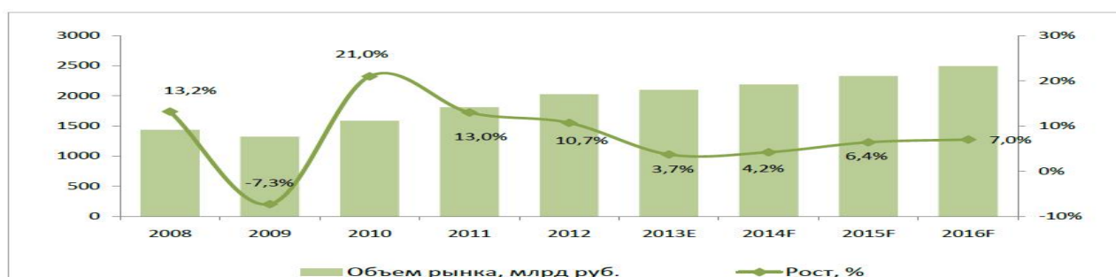
Рисунок 2. Объем рынка транспортно-логистических услуг в РФ в разные годы [2]

Современный рынок логистики выделяет пять видов аутсорсинга в логистической сфере, которые выделяются списком услуг и предоставляют их операторы сферы логистики.